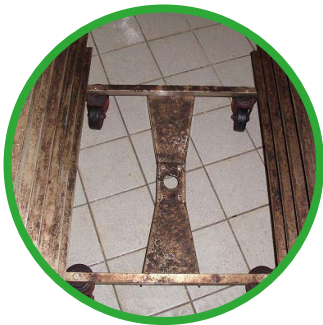
Bild: Stikkenwagen vor Reinigung

Renosan Stikkenwagenreiniger ist ein alkalisches Reinigungsmittel zum Aufweichen und Lösen von eingebrannten Verkrustungen, Back- und Fett-rückständen auf Edelstahl-wagen. Stikkenwagenreiniger ist ein Konzentrat und wird zusammen mit Aufschäumer und Wasser mit dem Druckluft-Schaumgerät von Renosan oder in Stikkenwagen-Wasch-anlagen zu einem kräftigen Schaum verarbeitet. Stikken-wagenreiniger löst selbsttätig und schnell auch alte Krusten.