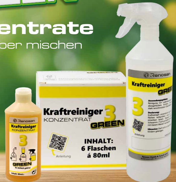
Renosan GREEN Kraftreiniger Konzentrat